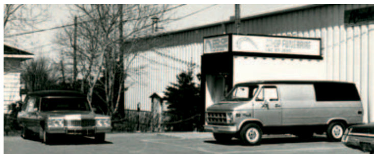
Les premières installations de la Coopérative