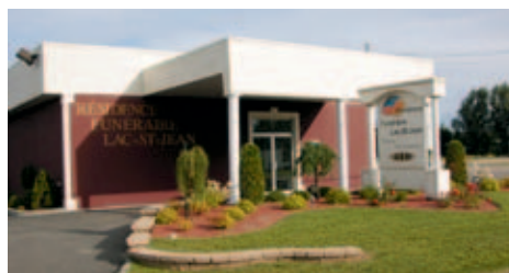
Installations actuelles à Alma et à Hébertville