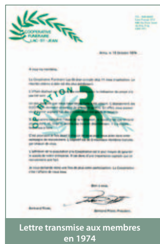
Lettre transmise aux membres en 1974